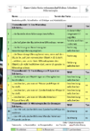
Kann-Liste und Punktekonto