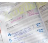
Planung des Lernateliers mit dem Logbuch